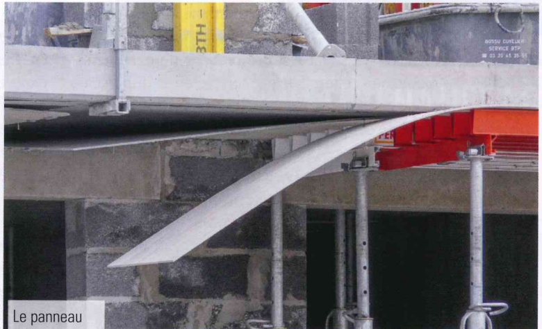
Le panneau coffrant Coffranov 10 de Novafloor se décoffre tout seul, pour ainsi dire...